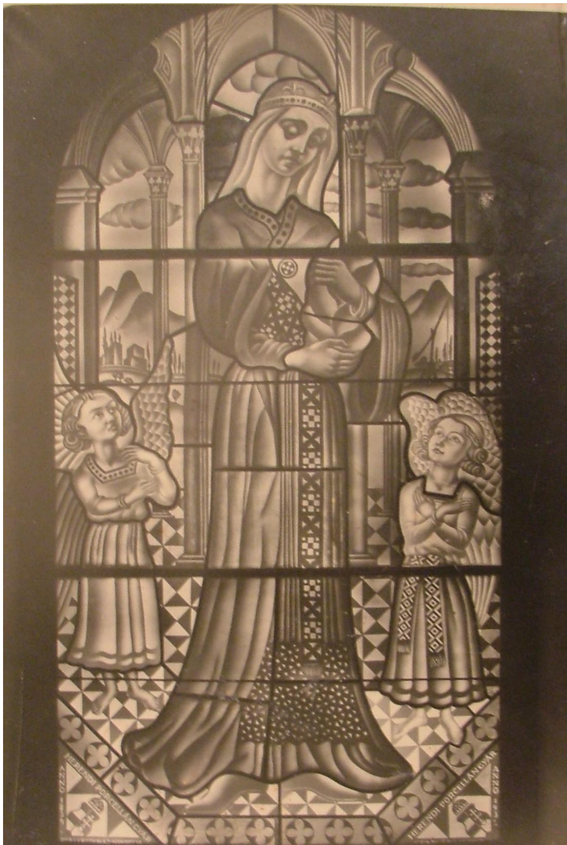
Herendi Római Katolikus templom – Herend, Kossuth Lajos u. 38